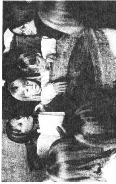
Et hellig ansvar : 44 008 barn ble døpt i 2004

Som et ledd i kvalitetssikring av det lokale forsøks- og utviklingsarbeid er det opprettet en mentortjeneste. Mentorenes rolle er å holde ved like de faglige problemstillingene i forsøks- og utviklingsarbeidet i det enkelte prosjekt. Tjenesten er etablert som et samarbeid mellom Styringsgruppa for Reform av trosopplæringen og IKO. Sekretariatet for